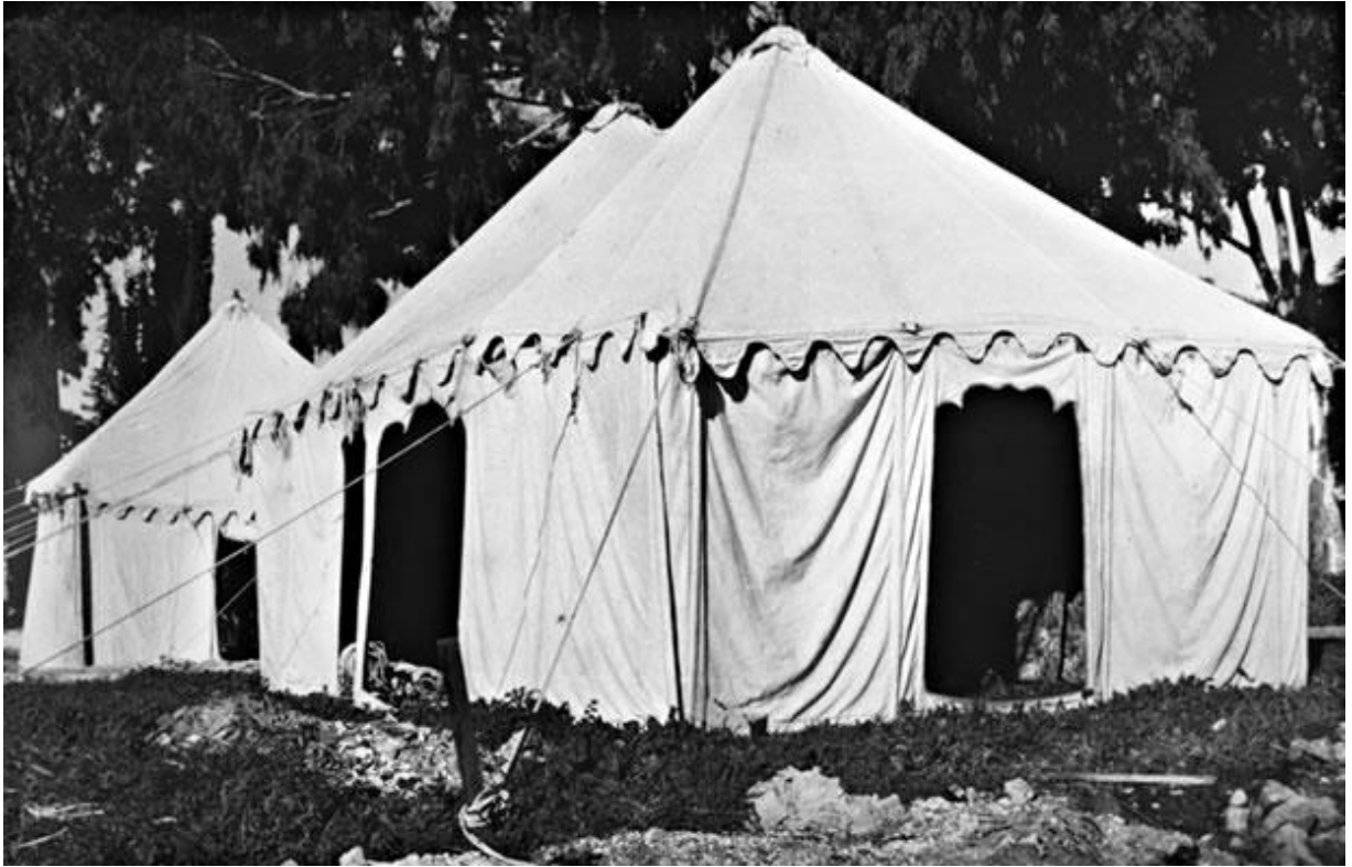
Шатер Бахауллы (В Хайфе на горе Кармель)

Каждое утро друзья собирали розы, а затем складывали их в центре шатра; и вырастала огромная гора цветов, заслоняя собой людей друг от друга.