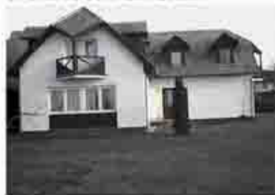
На фото – типичный домик для проживания

Тема школы – «Вместе по духовному пути». Основной лектор – г-н Ян Сэмпл, в прошлом член Всемирного Дома Справедливости. Общая стоимость питания и проживания – 98 евро. Желающие принять участие должны зарегистрироваться, до 31 мая оплатив 50 % стоимости школы.