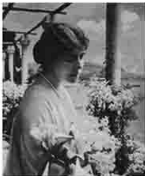
На фото – Королева Мария, бахаи.

Свои двери для участников школы распахнет летний дворец румынской королевы Марии, расположенный на черноморском побережье в Бальчике (к северу от г. Варна). Рядом с дворцом находится известный ботанический сад. Проживание в дворцовых виллах.